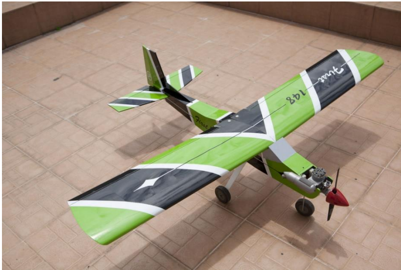
4131 SPACE WALKER électro 1,58 m 119,00 € au lieu de 169,00 €